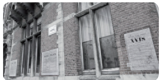
Oorlogsaffiches aan gevel Huis Janssens